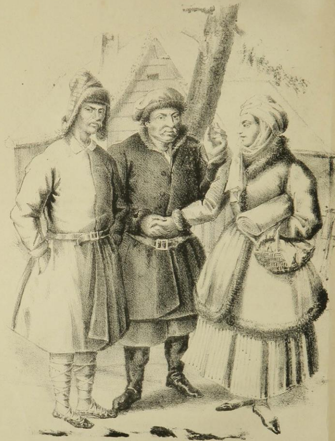
WIENIACY Z OKOLIC BORYSOWA.